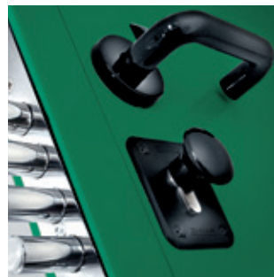
POMOLO CILINDRO, LATO INTERNO CYLINDER KNOB, INTERNAL SIDE