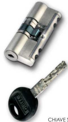
CHIAVE STANDARD STANDARD KEY