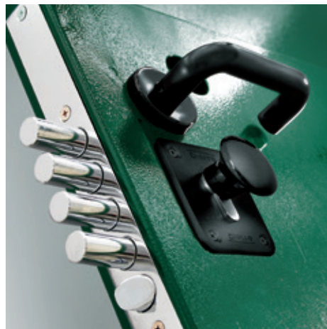
UNDER CON SERRATURA A CILINDRO UNDER WITH CYLINDER