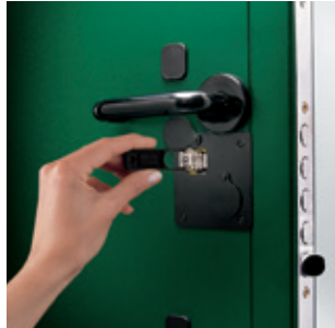
CAMBIO BLOCCHETTO MIA REPLACING THE MIA BLOCK

In caso di tentata effrazione, il sistema interviene e blocca la serratura. Ma, una volta estratto lo strumento di manomissione, libera il meccanismo e ne consente la normale apertura con chiave regolare. Inoltre, grazie all'esclusivo brevetto MIA, in caso di furto, smarrimento o sospetta copiatura delle chiavi, è possibile effettuare la sostituzione del blocchetto centrale, senza cambiare l'intera serratura.