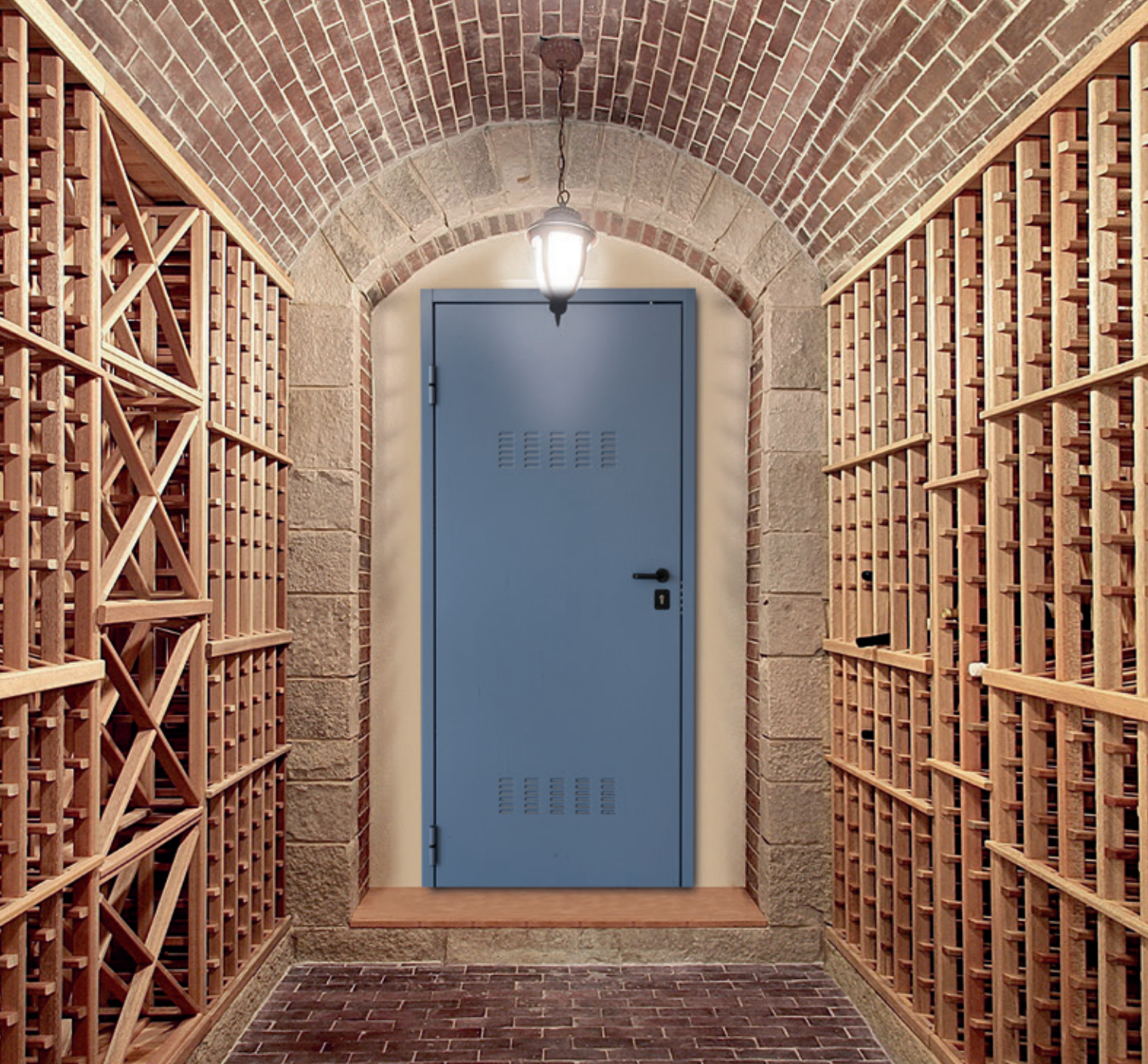
Under 1 laccato RAL 5014 Under 1 lacquered RAL 5014