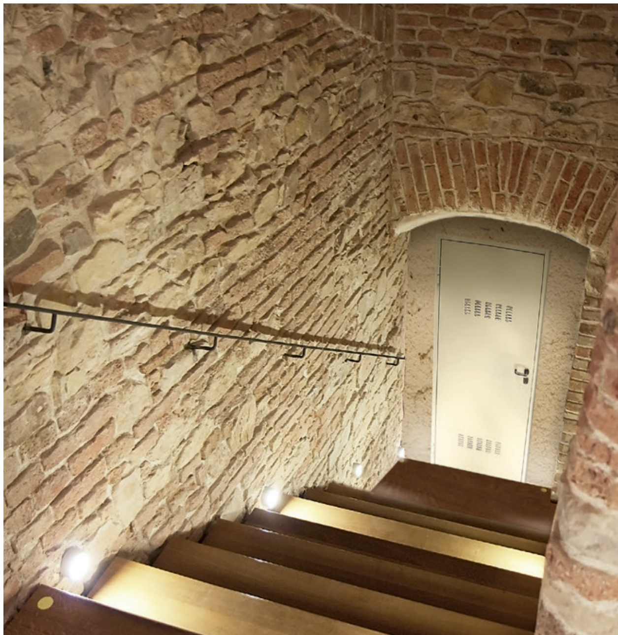
Under 2 laccato avorio Under 2 lacquered ivory