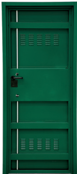
Under 1 lato interno Under 1 internal side

The available versions are UNDER 1 , with single sheet structure and UNDER 2 , with double sheet structure. For ease of installation, depending on the type of wall, both models can use two types of frame: the vice-type frame makes installation quick and allows the finishing on both sides of the wall; the tubular-type frame requires instead the use of wall anchors. The proposed locks are to be chosen between Lock Trap System with double bit or New Power with high security cylinder.