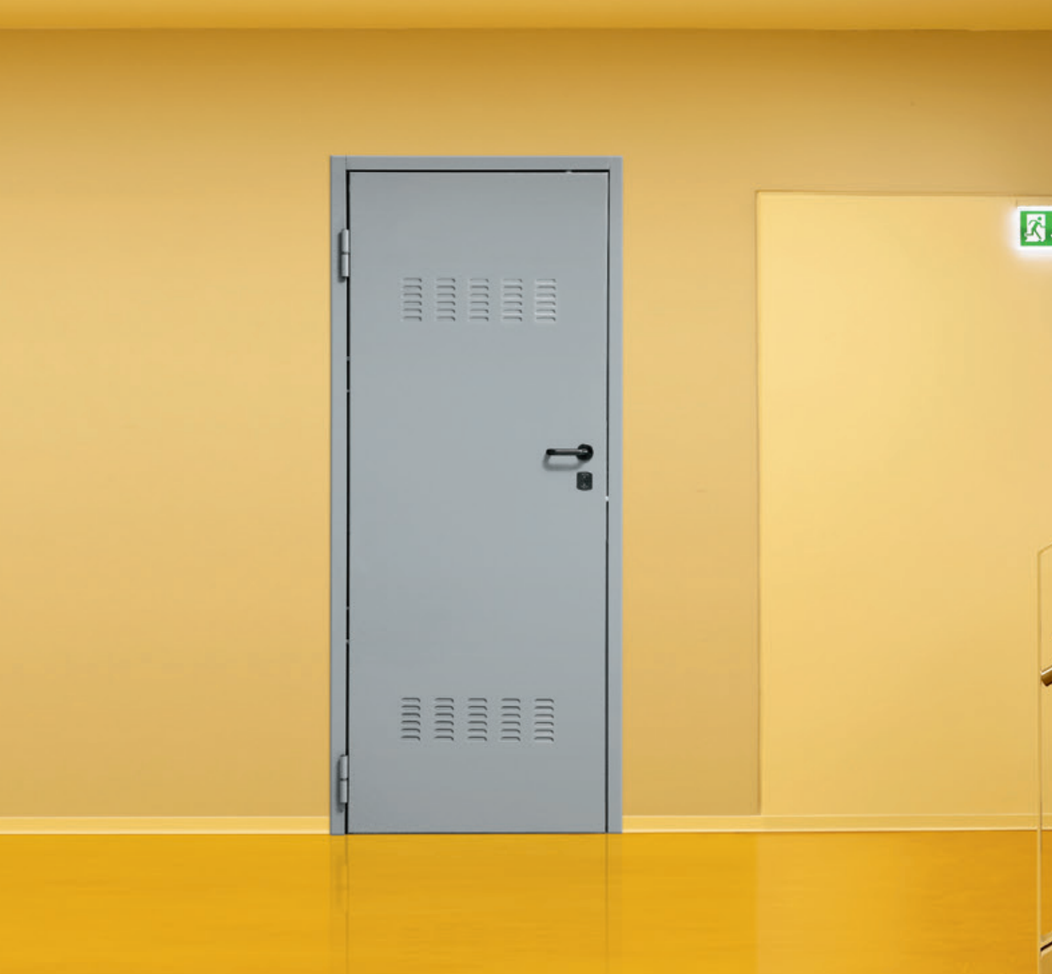
Under 2 con rivestimento grigio laccato RAL 7040 Under 2 with grey panelling lacquered RAL 7040