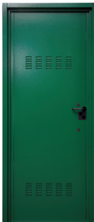
Under 2 lato interno Under 2 internal side