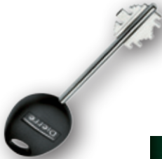
NEW COLOR KEY